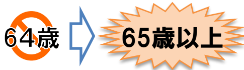
高齢者雇用確保措置 実施義務化年齢の段階的引き上げのイメージ (60歳定年企業において継続雇用制度等を導入の場合)